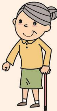
足腰が弱く 歩行が不安な方…など