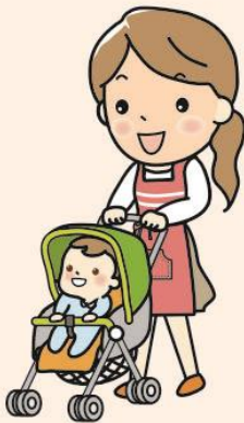
乳幼児を お連れの方